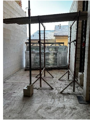
Fenster für den Einbau