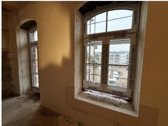
Dämmarbeiten in den Fensterlaibungen