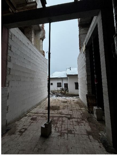
Gebäudeausschnitt Nordseite im EG