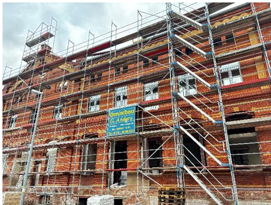
neue Fenster im 1. Obergeschoss