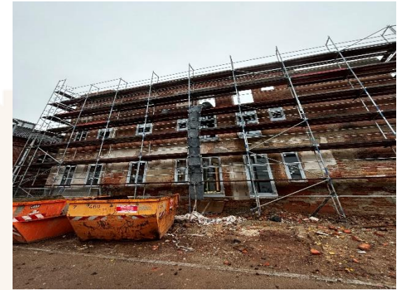
Ostseite neue Fenster