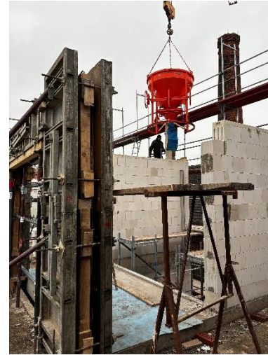
Betonarbeiten im 2.OG