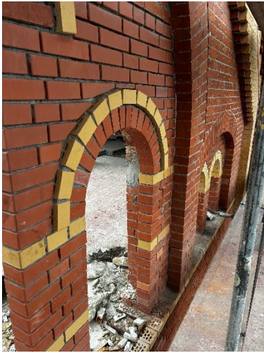
Herstellung der Fassade