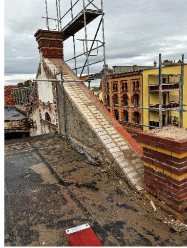
Restaurierung des Giebels