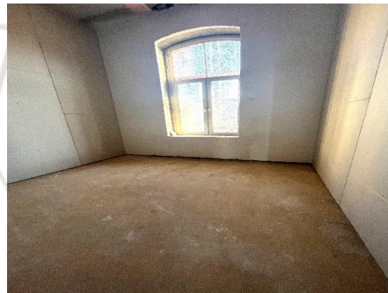
erste Räume sind entstanden