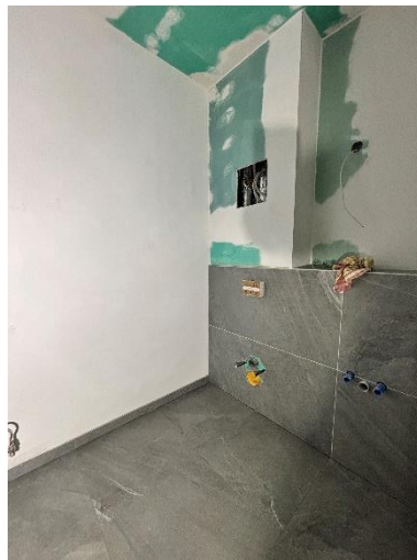
Erste Bäder sind fertig gefliest