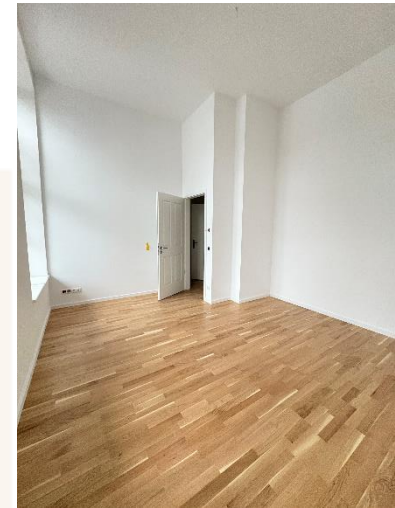
Wohnzimmer mit Parkett