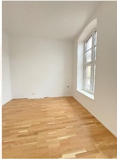
Schlafzimmer mit Parkett