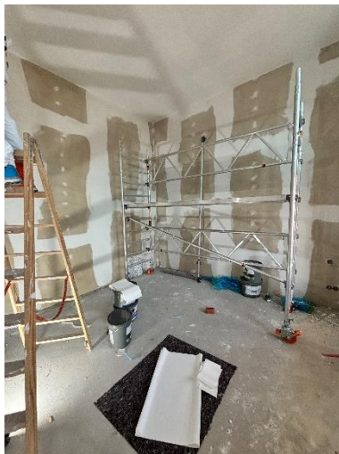
Vorbereitung Vlieskleben/ Malerarbeiten