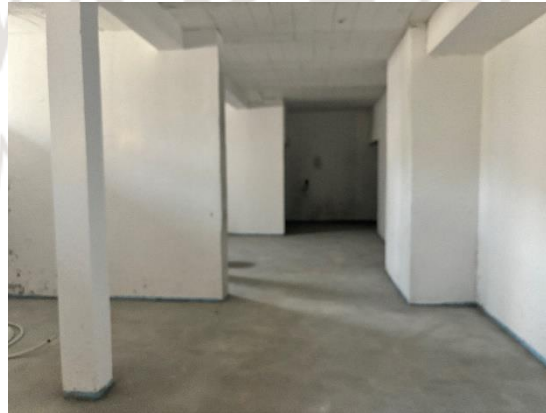
Sauberkeitsschicht im Keller wurde eingebracht