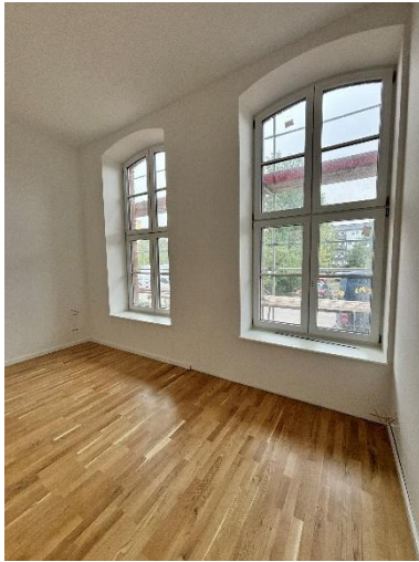
Parkett ist im Erdgeschoss verlegt