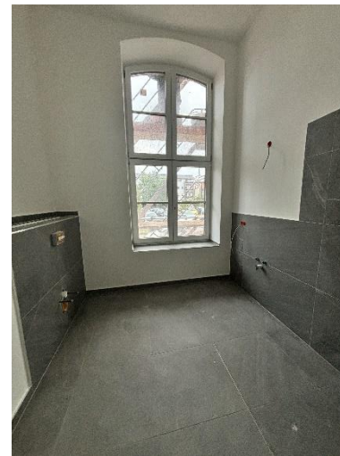
Bad im Erdgeschoss