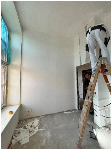
alle Wände werden mit Vlies beklebt