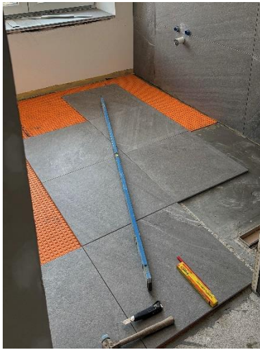
Die ersten Bäder werden gefliest